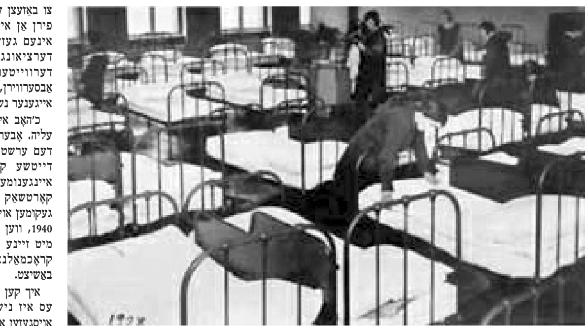
דער בית היתומים פון יאַנוש קאַרטשאַק אין וואַרשע.