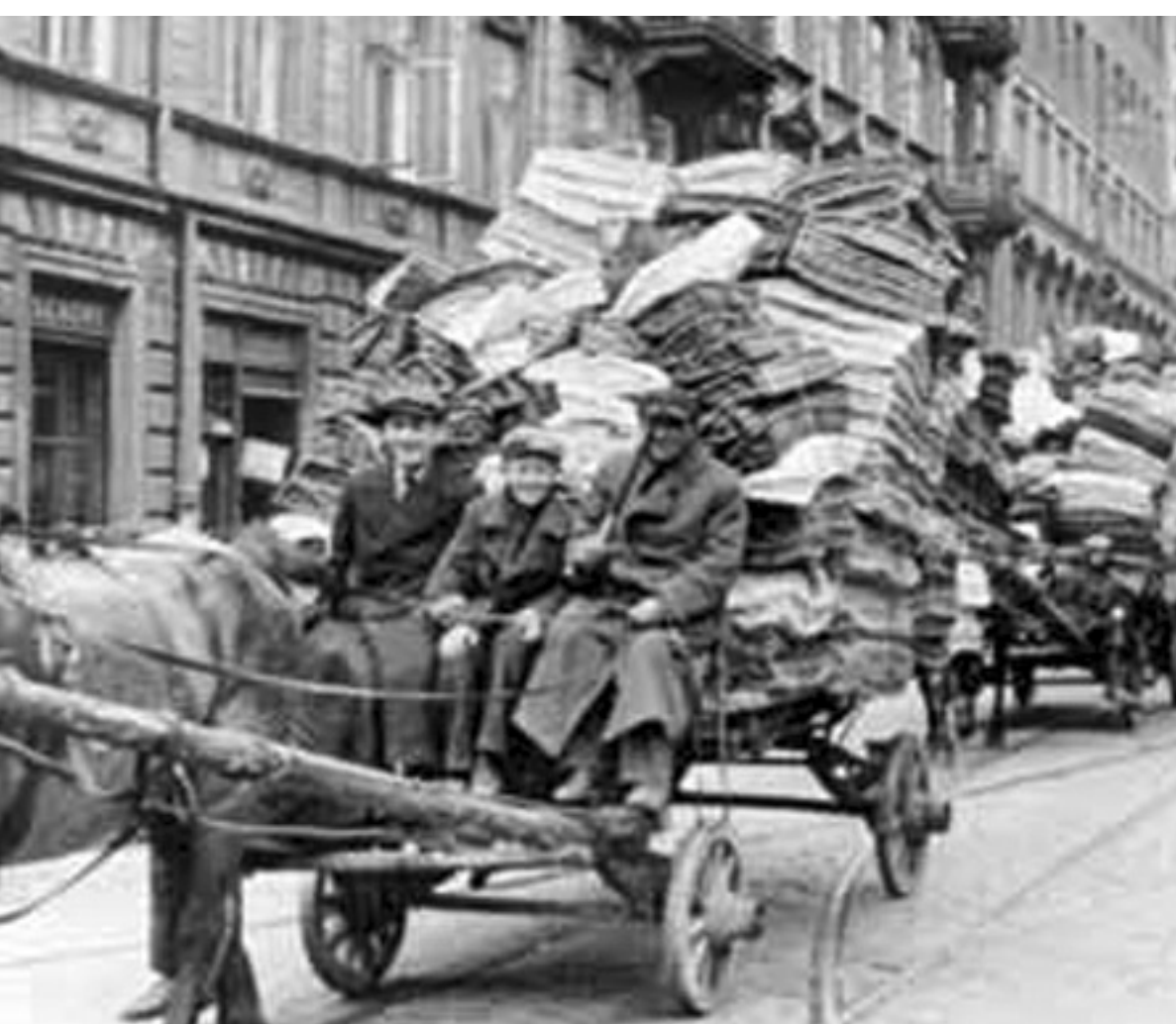
1940. אײמן באַפעל פון די נאַציס ימ"ש, האָט זיך דער בית היתומים פון יאַנוש קאַרטשאַק איבערגעקליבן צום וואַרשעווער געטאָ.