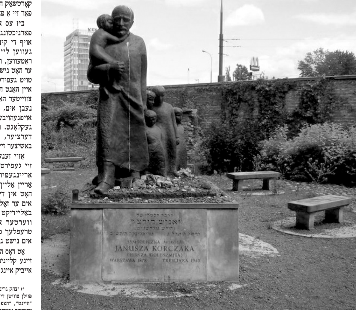
דער געשטאַלט פון יאַנוש קאַרטשאַק אין דעם אַיזשן בית עולם אין וואַרשע.

אַט דאָס הייליקע בילד פון קאַרטשאַק וואָס גייט אַרויף נאָך זײנע קלייניקע קינדערלעך אינעם טײט=וואַגאָן וועט אויף אײביק איינגעקריצט ווערן אינעם האַרץ פון אַיזשן פּאַלק.