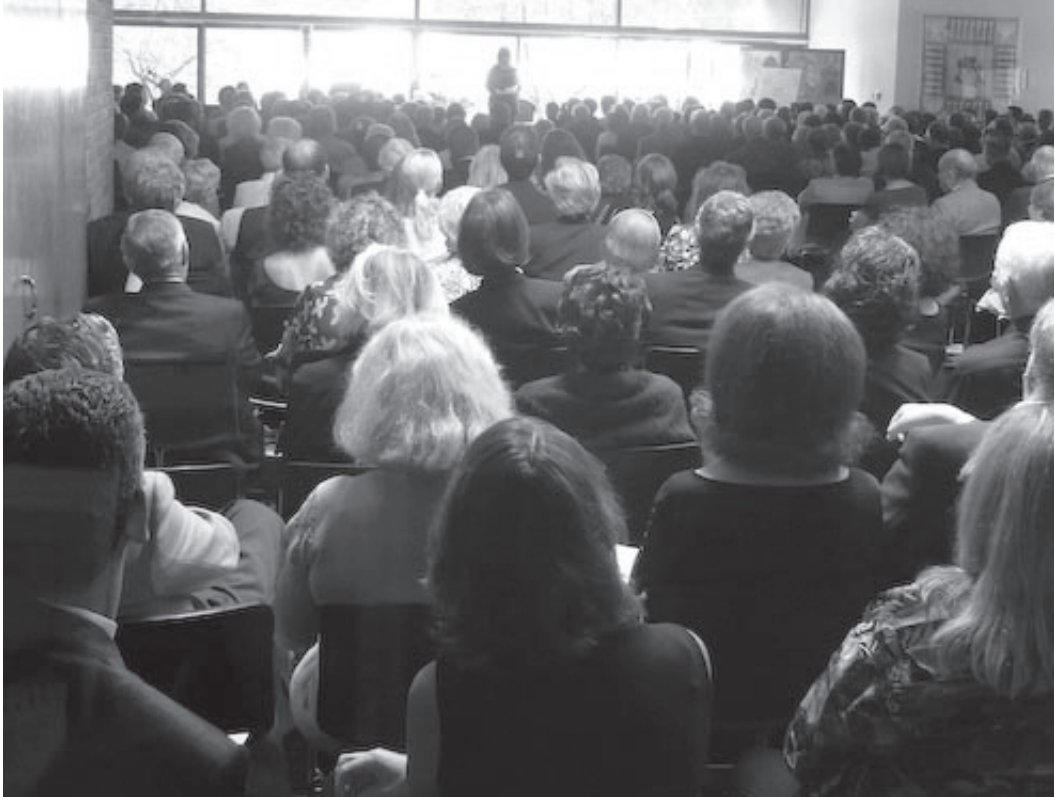
ביי דער יאָרצייט-אזכרה פון שערוריין וויין ז"ל

פאַרט. מען איז ניט צוגעוויינט צו אַזאַ מיין שלום=עליכם אויף אידיש. נאָך אין ווילע פון אַן אַמעריקאַנער גאַסט. מען איז איינגעוואוינט אויף אַ