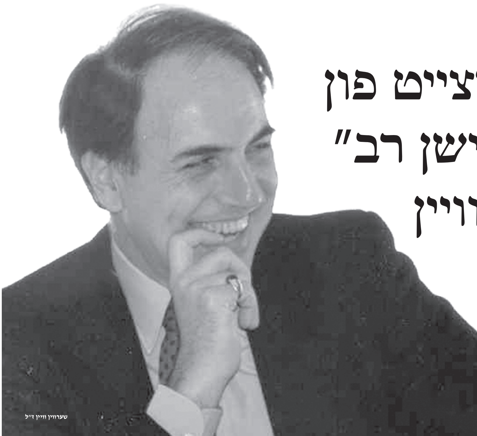
שערוריין וויין ז"ל