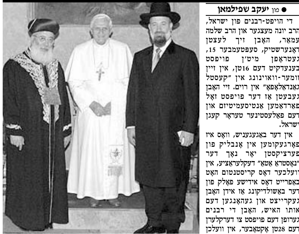
הרב שלמה עמאר, דער ספרדישער הויפט רב פון ישראל, לינקס, און הרב יונה מענצער, דער אשכנזי רב הראשי (רעכטס), בעת זייער באגעגעניש מיטן פויפסט לעצטן דאגעשריטק אין ווין