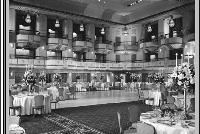
פארענצונג אויף זייט זעקס

דעם מאנטיק האט אריאל שרון דערקלערט: "איך וועל בלייבן אין ליכוד און איך וועל געוויינען". שרון האט אבער נישט געזאגט וואס ער וועט טאן אויב עס וועט באשלאסן ווערן נעקסטן דינסטיק צו מקדים זיין די פרימיערס. וועט זיך שרון אפשיידן פון דער ליכוד און גרינדן זיין אייגענע פארטיי? איז א פראגע וואס איז נאך נישט געענטפערט געווארן. בנימין נתניהו, וועלכער קעמפט צו איבערנעמען שרונים אין דער פירערשאפט פון ליכוד, האט דעם דינסטיק געזאגט אז שרון גרייט צו א